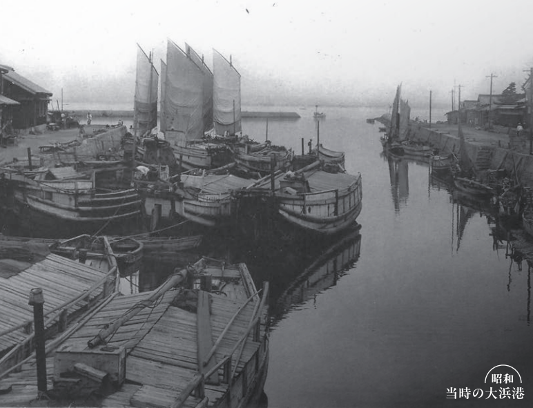
昭和 当時の大浜港

南北朝時代から昭和中期まで、大浜港として海運業などで栄えた碧南大浜。その往時の模様を講話や写真で味わうとともに、歴史文化遺産があるこの町の、これからを考えるシンポジウム。