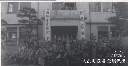
昭和 大浜町役場 金属供出